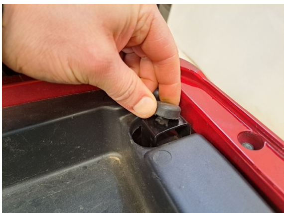
Ota vaimenninkumi pois.