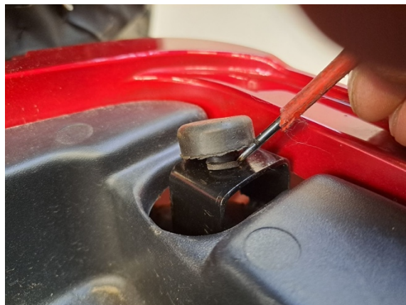
Laita uusi vaimenninkumi paikalleen esimerkiksi meisseliä apuna käyttäen.